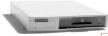
nShield key management and acceleration